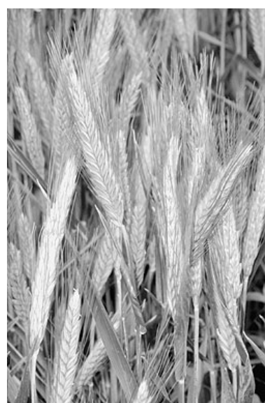
Augusztus 20-ára kenyér sül az új búzából

Az esős időszak viszont kedvezett a napraforgónak, szépen fejlődik, s elkezdett emelkedni a garantált felvásárlási ár. Szintén kedvező hatása volt a