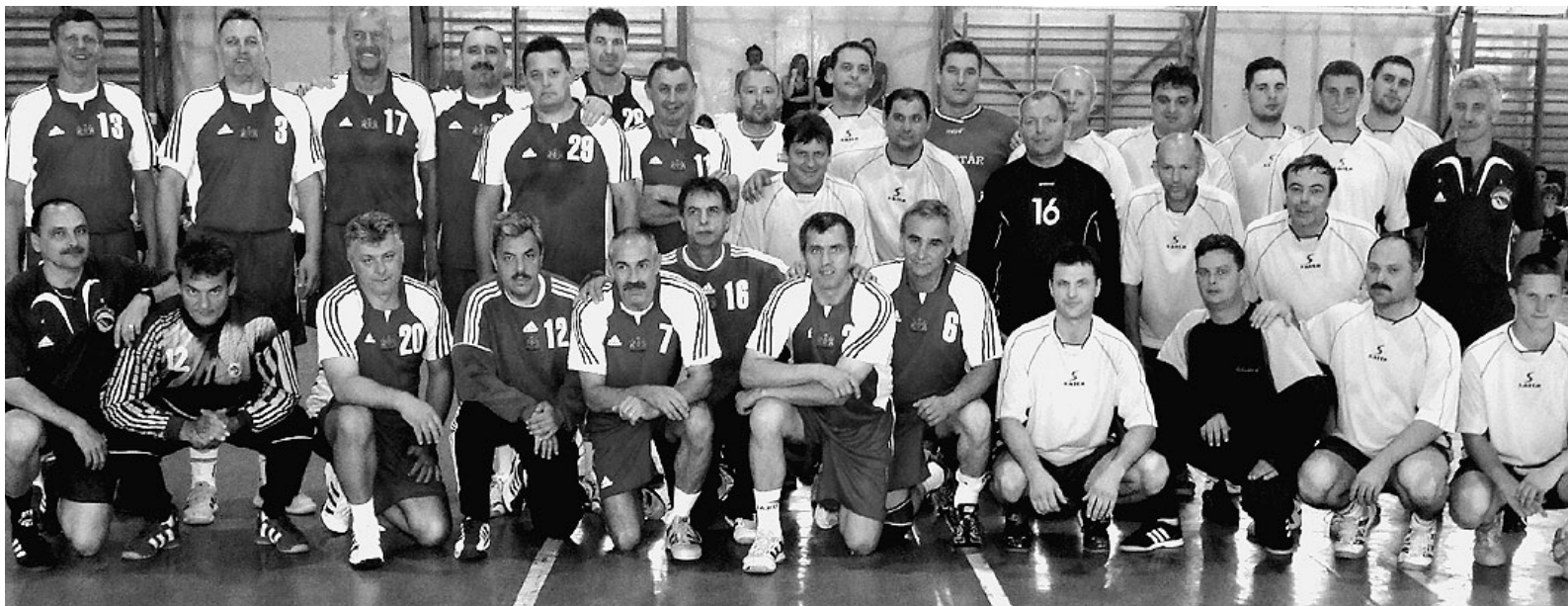
Az „Old Boys” csapatok