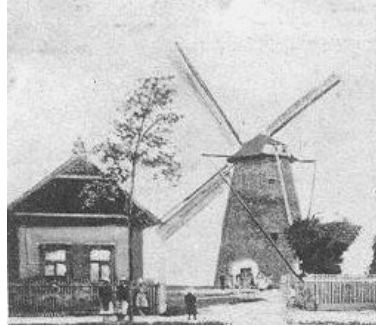
Az egykori szélmalom látképe