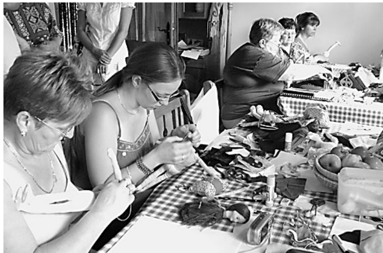
Ma is készülnek Róza babák