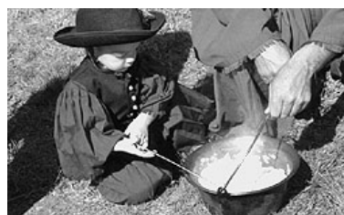
Népi hagyományaink érdekelhetik az ide látogatókat

A kétéves, nappali szak OKJ-s vizsgával zárul, melyre még lehet jelent-