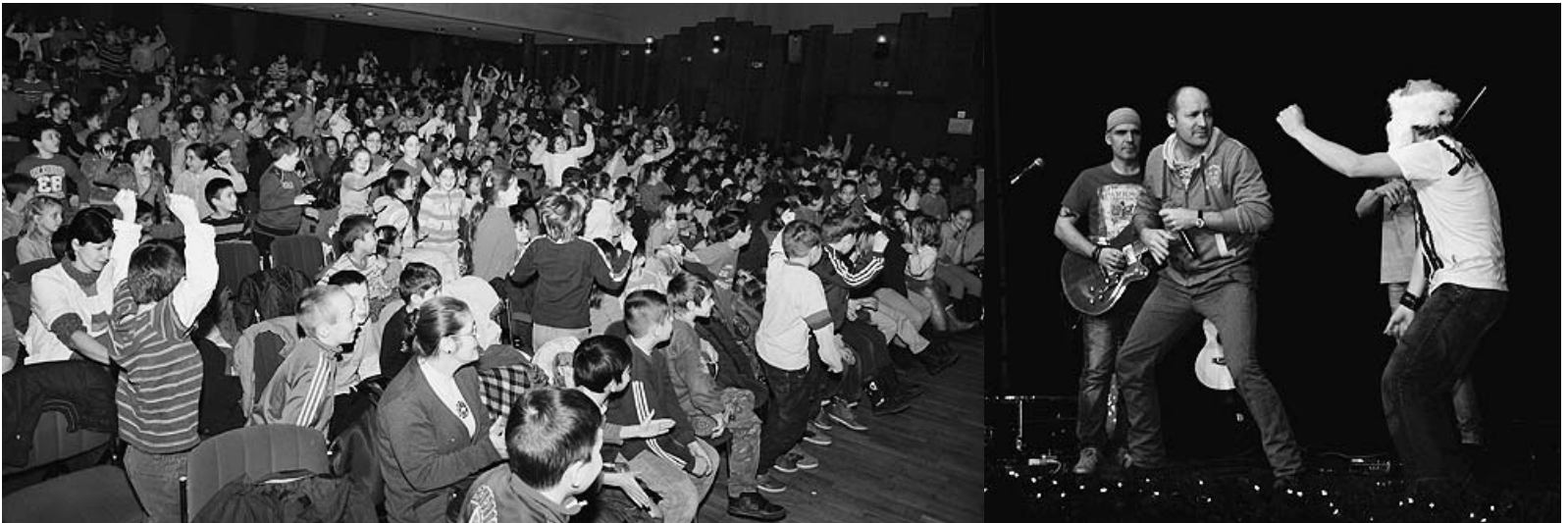
A kisiskolások is nagyon élvezték az Alma együttes koncertjét