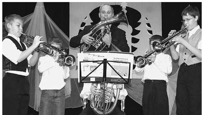
A karácsonyi hangverseny egy pillanata