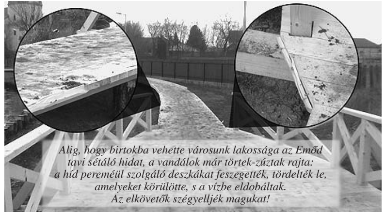
Alig, hogy birtokba vehette városunk lakossága az Emőd tavi sétáló hidat, a vandálok már törtek-zúztak rajta: a híd pereméül szolgáló deszkákat feszeggették, tördelték le, amelyeket körülötte, s a vízbe eldobáltak. Az elkövetők szégyelljék magukat!