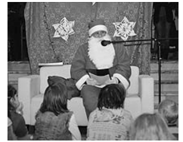
Két este, december 5-én és 6-án is mesélt a gyerekeknek Mikulás bácsi a művelődési házban. Az ünnepi dalokat éneklő gyerkőcöket szaloncukorral jutalmazta

Az adventi városi programok most is széles választékot kínáltak a kicsiknek, s nagyobbaknak egyaránt. Ezekről szóló képes visszatekintőket ezen az oldalon láthatják. A különbséget talán abban lehetett észrevenni, hogy az egyes programok több érdeklődőt vonzottak, mint korábban. Kenyér lángos se fogyott még ennyi az ünnepi forgatagban. Lehet, hogy elindult valami a nádudvari kulturális, közösségi létben? Az évzáró rendezvény, a batusz szilveszter mindenesetre telt házzal zajlott... Marján László