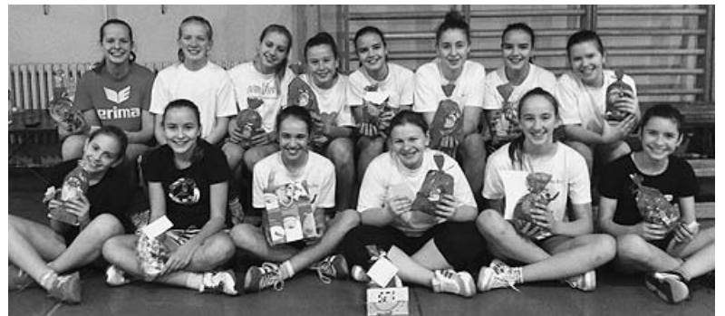
A Mikulás alkalmából megajándékozták egymást a csapattagok, amit nagyon élveztek a lányok

Eredményeink: Felföldi SE Újkígyós–Nádudvari Akarat SK 6–22 (2–10), Orosházi FKSE–NASK 13–13 (3–6), Gyulai SE–NASK 3–21 (2–11).