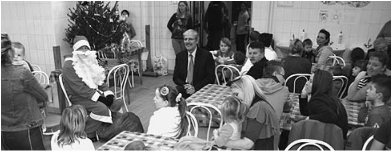
A Mikulás csak jó gyereket talált, virgácsot nem is hozott