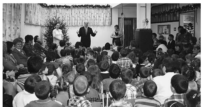
Az óvoda- és városvezetőknek énekeltek ünnepi dalokat a Napfény Óvoda és Bölcsőde növendékei karácsonyi ünnepélyükön