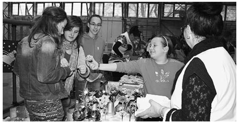
Az iskolai vásár most is népszerű volt