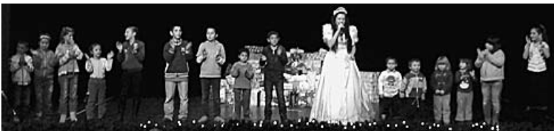
Sok gyerkőcnek szereztek örömet

Igen sikeres volt az Angyalkert Gyermekház és Családi napközi által szervezett harmadik nádudvari Karácsonyi cipősdoboz akció. A Szociális Szolgáltató Központ által az Ady Endre Művelődési Központban megrendezett ünnepi műsor keretén belül 178 gyermekhez tudtak ajándékot eljuttatni, s ezáltal szebbé tenni a rászoruló családok karácsonyát!