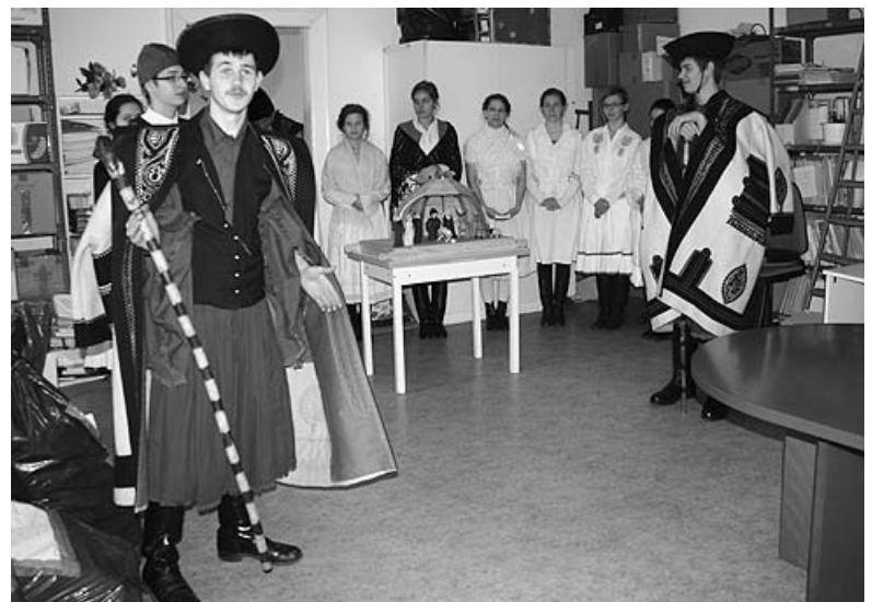
Megszokottan színvonalas és humoros Betlehemes karácsonyi köszöntőjükkel járták a város intézményeit a Nádudvari Népi Kézműves Szakiskola diákjai