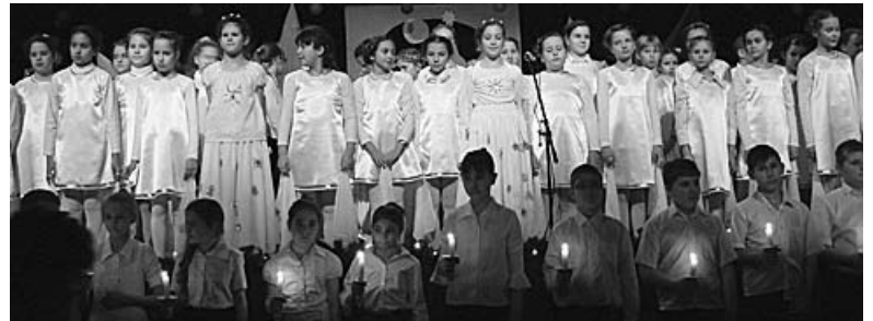
Meghajlás előtt - a negyedikesek műsora