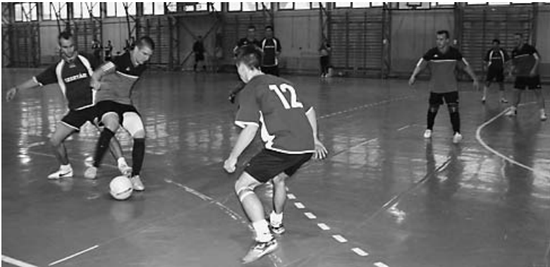
Küzdelmes pillanat a 3. forduló nyitómérkőzéséről (Football Factor–Joker 4–5)

Sok a jó csapat a téli teremlabdarúgó bajnokságban