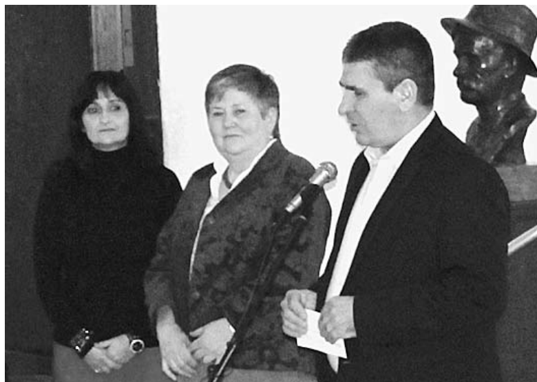
Az ünnepet (középen) köszöntötte a megyei közgyűlés elnöke és a helyi művelődési ház igazgatója is

Egyértelműen látszik, hogy Nádudvar városa jó irányba halad – vélekedik országgyűlési képviselőnk. Fontos, hogy az elkezdett fejlesztéseket nyugodtan be lehessen fejezni, hogy a fejlődés tovább tudjon menni, s ehhez a meglévő értékek megőrzése mellett a folyamatos-ságra is szükség van.