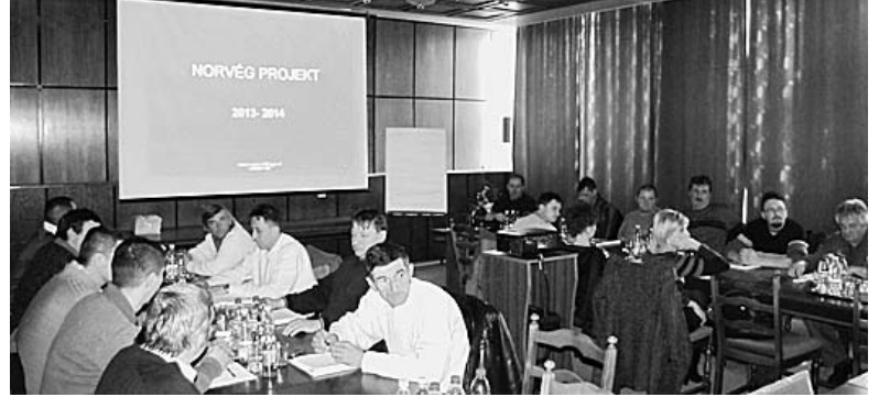
Korszerű ismeretekkel gyarapodtak a Nagisz Zrt. munkavédelmi képviselői