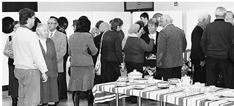
Sokan tették tiszteletüket a január 31-i megnyitón