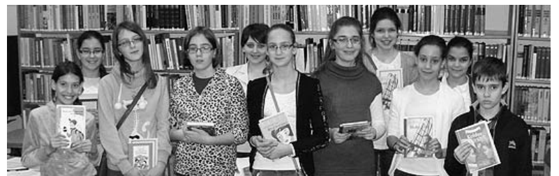
Szépen olvastak