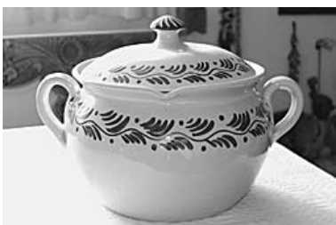
Mázás edényein is megfigyelhetők az egyedi stílusjegyek

– Az 1950-es évek legelején Fazekas nagymamámtól tanultam el a fekete kerámia díszítésének, az ún. síkálásnak a művészetét. Ekkor léptek be a családtagjaim a fővárosi székhelyű Népművészek Házipari Szövetkezetébe, amely biztos megrendeléseket jelentett számukra. Az általános iskola jó eredménnyel való elvégzése után jómagam is be akartam állni a dolgozók sorába, ám anyai nagymamám biztatására beíratk a hajdúszoboszlói gimnáziumba. Ez azonban nem is volt olyan egyszerű, mint azt mai fejjel gondolnánk. A buszreggel 6 óra 14 perckor indult a központból, a mai művelődési ház környékéről. Nekem ehhez egy órával korábban kellett elindulnom a Simkókerth végéről, este meg negyed hét volt mikor hazaértem. Olyankor nálunk mindig volt valaki vendégségben: szomszédok, barátok, ezért otthon tanulni nem is nagyon lehetett. Így sikerült elvégezni a középiskolát, amely után egy hozzánk járó – édesapámat különféle szakmai tanáccsal ellátó –, főiskolai tanár javaslatára jelentkeztem a budapesti Iparművészeti Főiskolára. A felvételin az egyik rajzomon nem sikerült a hokedlit valószínűleg ábrázolni, ezért nem vettek fel,