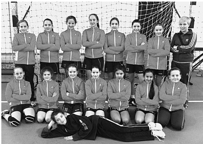
A Nádudvari DSE U12-es lány kézilabdacsapata

Február első hétvégéjén léptek újra pályára az Erima-bajnokság keretében korosztályos csapataink. Szombaton a balmaújvárosi Kőnig Rendezvényközpontban. „Bemelegítésként” a Téglás ellen győztek nagy fölényrel az U14-ek, azaz a nagyok. A Berettyóújfalun ellen szoros derbin sikerült elérni a győzelmet, míg a házigazdák megoldhatatlan feladat elé állították a Nádudvari Diákspport Egyesület tagjait. Vasárnap az U12-ek hazai pályán, a „Kövy-arenában” előbb a Túrkeve, majd a Köröstarcsa ellen diadalmaskodtak, míg a gyulaiakkal döntetlenre végeztek.